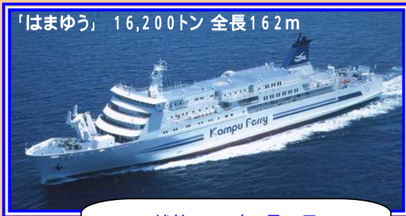
「はまゆう」 16,200トン 全長162m 就航 1998年8月28日 建造:三菱重工業下関造船所 MADE IN SHIMONOSEKI